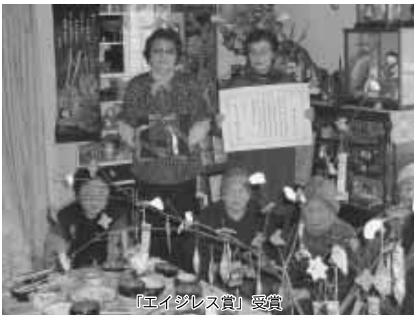
「エイジレス賞」受賞