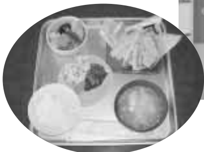
日替わりランチ 450円