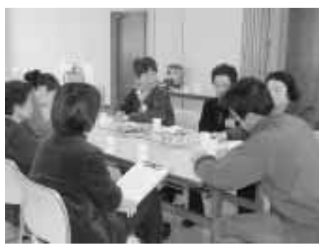
グループトーク「輪になっておしゃべり」中です

二月二十一日に、市内のボランティア活動をしている方、関心がある方が総合福祉センターに集い、ボランティア活動の内容や、困ったこと、活動をして変わったことなど、普段思っていることを語り合いました。 「ホッネー」で話し合える場ですばらしさと久慈市には心温かな人がたくさんいると感じる一日でした。