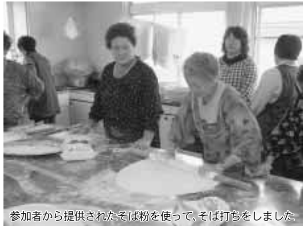
参加者から提供されたそば粉を使って、そば打ちをしました