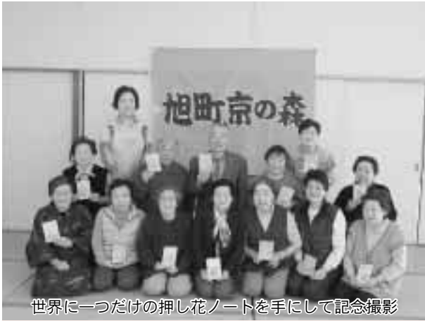
世界に一つだけの押し花ノートを手にして記念撮影

地域のたぐきり場「ふれあいサロン」。市内には60カ所のサロンがあります。平成21年度には7カ所の新しいサロンが誕生しました。どこのサロンも、みんな、みんな、すてきな笑顔です。