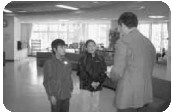
小久慈小学校のみなさんの思いやりの心がたくさん詰まった募金箱。ありがとうございました