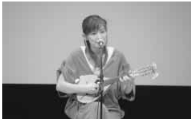
歳末たすけあい芸能大会 スペシャルゲスト清心さん