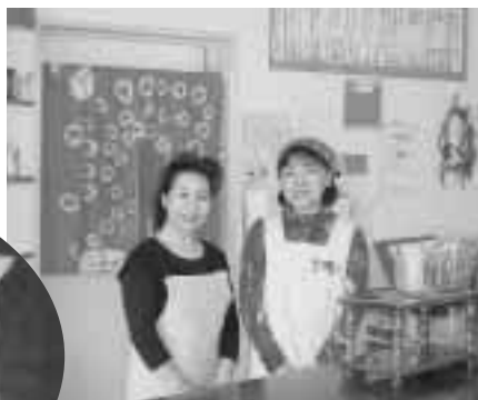
お待ちしております

久慈市総合福祉センターのティールウンジ「ホットタウン」の定休日が火曜日となりました。 「ホットタウン」の一番人気は何と云っても、栄養満点、ボリューム満点の日替わりランチ（四五〇円）です。 温水プールや福祉センターの利用の際には、どうぞ、お立ち寄りください。