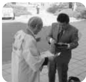
10月1日 街頭募金 ご協力ありがとうございました