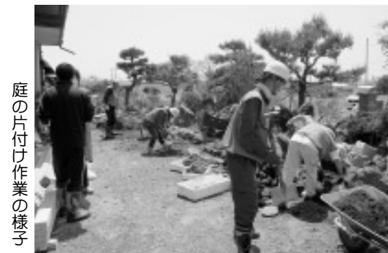
庭の片付け作業の様子