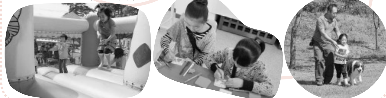
エアートランポリンは子どもに大人気!!