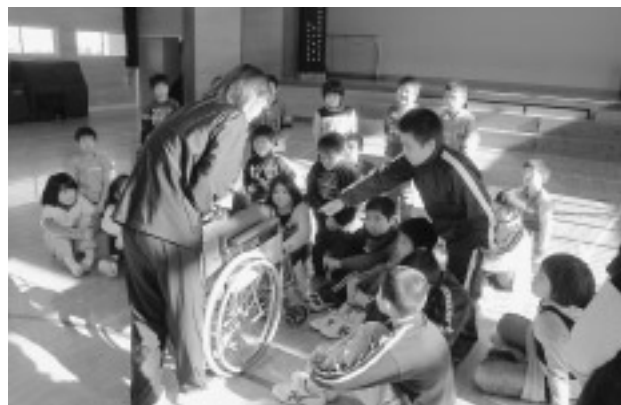
キャップハンディ講習会 (待浜小学校) の様子