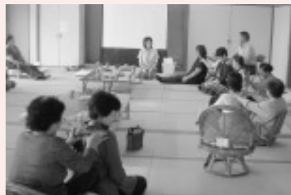
サロン活動の様子