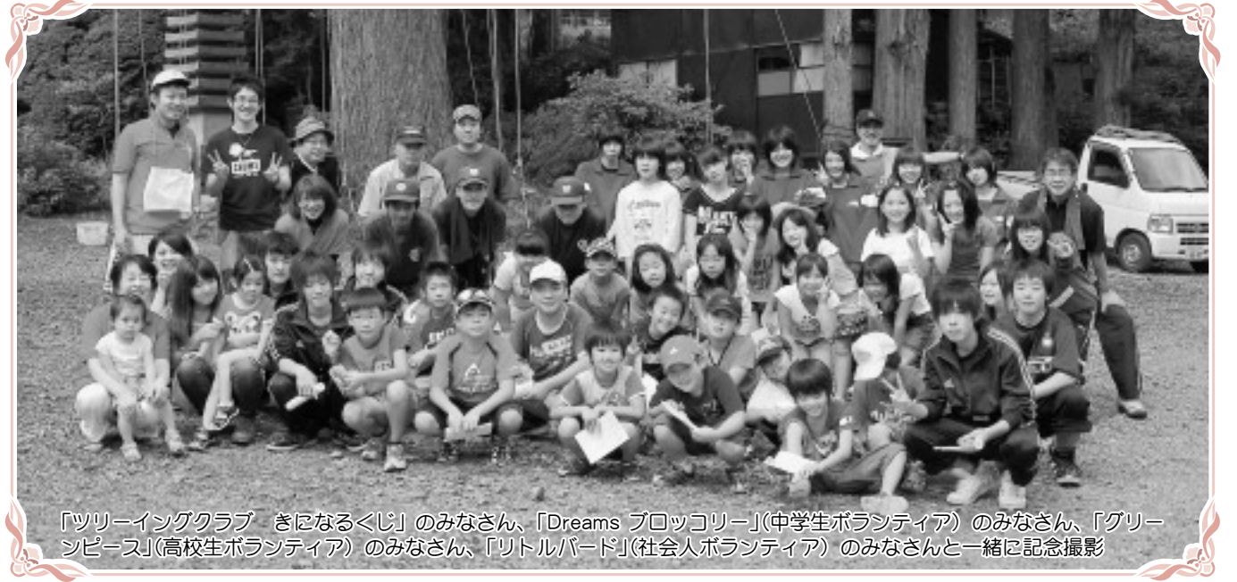
「ツリーイングクラブ きになるくじ」のみなさん、「Dreams フロッコリー」(中学生ボランティア)のみなさん、「グリーンピース」(高校生ボランティア)のみなさん、「リトルバード」(社会人ボランティア)のみなさんと一緒に記念撮影

市内小学生22名の参加とボランティア41名（中学生、高校生、一般）の協力で、寺子屋合宿を開催いたしました。 小学生のお世話係は、高校生のお兄ちゃん、お姉ちゃん。思いっきり遊んでくれたり、たまには注意してくれたり、子どもたちはたくさんの人と出会い、思いやりの心を学びました。