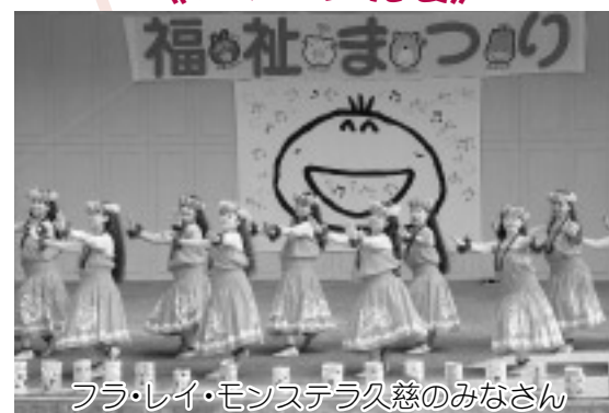
フラ・レイ・モンスター久慈のみなさん