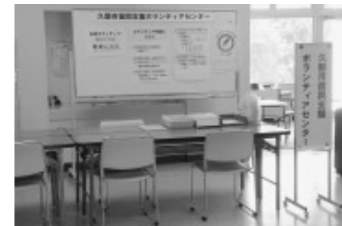
復興支援ボランティアセンター窓口

社協では、被災された方の生活復興支援として、「ボランティアの派遣」、「生活福祉資金の貸付」のほか、8月から配置した生活支援相談員による「相談活動等」を実施しています。お気軽にお問い合わせください。