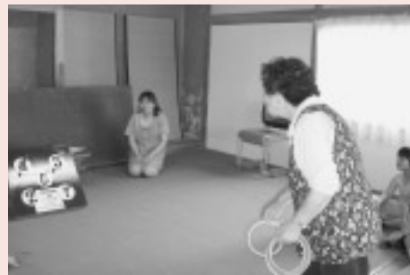
「旭町・京の森ふれあいサロン」 介護予防や小学生との交流に活用します