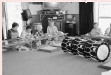
「麦っ娘」 世代間交流と伝承活動に活用します