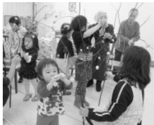
「しあわせSUN つどいの広場」みずき団子作りの様子