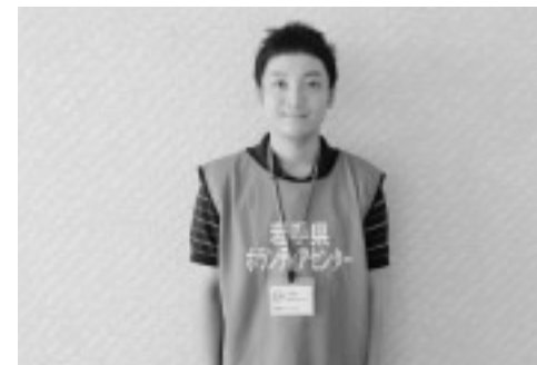
活動中に着用するネームプレートとベスト

3月19日から久慈市、久慈青年会議所、ボランティア団体と連携して「久慈地区災害ボランティアセンター」を立ち上げ、ボランティアの登録や派遣を行ってきましたが、瓦礫撤去など災害復旧支援が収束傾向にあり、今後は日常生活を支えるボランティア活動も必要となってきました。 そこで、10月1日から「久慈市復興支援ボランティアセンター」に名称を変更し、活動していくこととしました。派遣依頼は、これまでどおりです。お電話でお申し込みください。