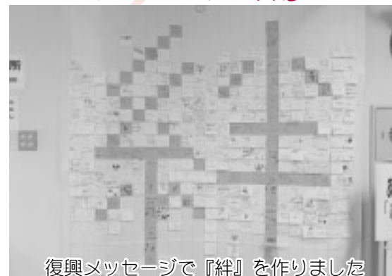
復興メッセージで『絆』を作りました