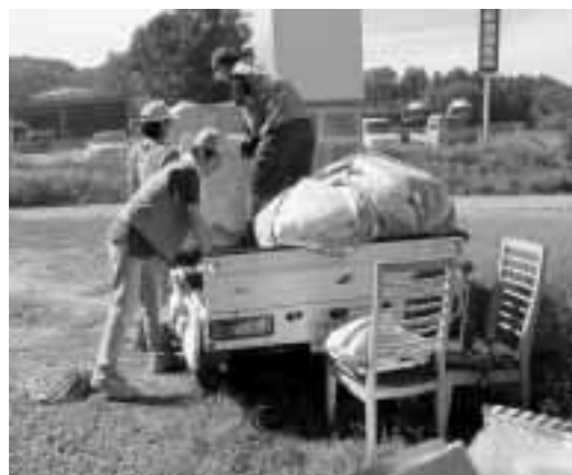
引越しのボランティアの様子