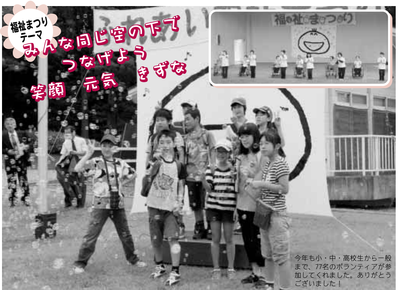
今年も小・中・高校生から一般まで、77名のボランティアが参加してくれました。ありがとうございました！

9月9日(日)、福祉の村において、福祉施設・団体やボランティアの皆さんのご協力をいただき「平成24年度ふれあい福祉まつり」を開催しました。