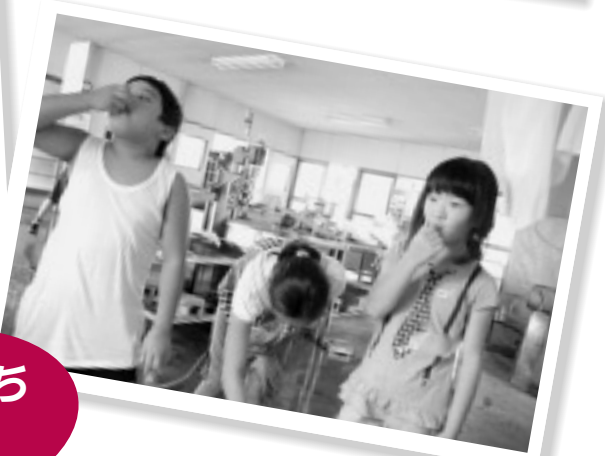
友だちといっしょに お寺に泊まりました！