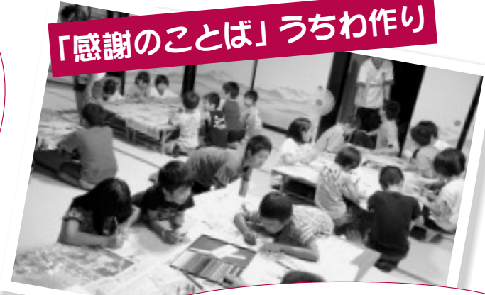
「感謝のこぼ」うちわ作り