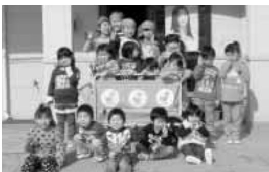
寄贈品に喜ぶ小袖保育園の園児たち