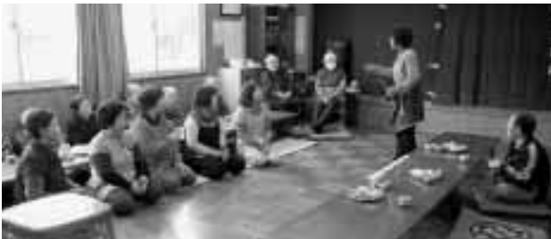
ふれあいサロンの様子（かかしの会）