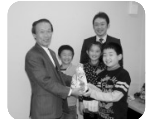
平山小学校のみなさんによる学校募金