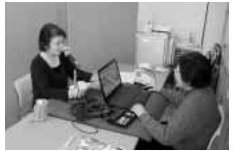
「声の広報おとさた」のみなさんによる録音風景