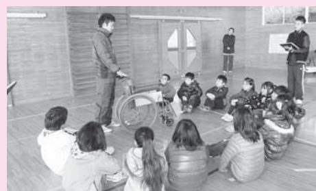
キャップハンディ出前講座 (平山小学校)