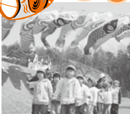
今年度の鯉のぼりフェスティバルオープニング