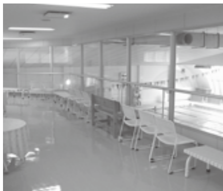
2階休憩室。プール室内が一望できます。見学などにもご利用ください。