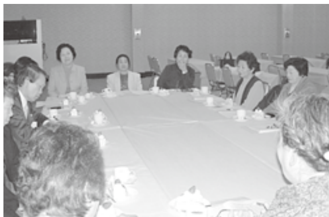
▲家族への思いや、失敗・感動エピソードも話されたグループ体験交流会。

市内催事場で開催された「家庭介護者のつどい」には、家族の介護をされている27名の方が参加しました。午前中は「介護者の“こころ”を疲れなくする大切さ」について講義を受け、昼食・入浴のあとは、夫婦や嫁、子などの立場ごとに分かれて日頃の悩みなどを話し合い、ひとときのリフレッシュを図りました。