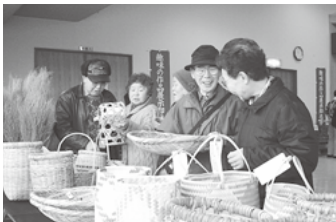
▲一つひとつの作品づくりが、高齢者の生きがい高揚につながっています。

趣味の作品展示即売会が総合福祉センターで開催され、高齢者が日頃の趣味活動で制作した約1,700点の作品が展示されました。木工品や手芸、竹細工など、丁寧な作品の数々が会場いっぱい並べられ、来場者の目を楽しませていました。