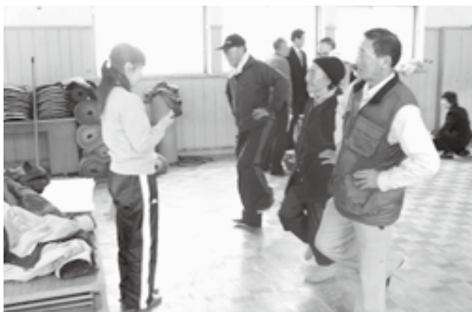
▲「おとっとと…」片足バランスも結構難しいものです。

高齢者講座「白樺大学山根地区学級」が山根公民館で開催されました。冬期間は、外出の機会が減少しがちになるため、体力測定、ニューススポーツ講習などを通じ、仲間とのふれあいや健康管理の大切さを再確認した一日となりました。