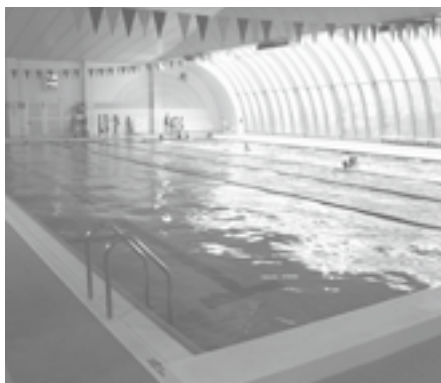
25m・6コース、水深1.1～1.3m 一般用プールです。