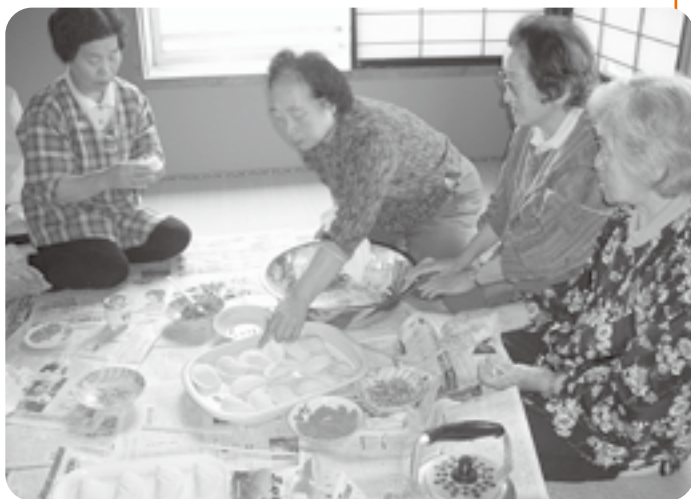
毎月2回開かれている山形町のふれあいサロン「ぬくもりの会」。今日は、黒砂糖とくるみ入りの「耳っこもち」を作って、みんなでおいしく頂きました。

『ふれあいサロン事業』とは、一人暮らしや、日中一人で過ごすことの多い方、高齢者世帯の方々などが、「歩いて来れる範囲」の小地域単位で集い、お茶飲みやおしゃべりをして交流する『たぐきりの場』を、地域住民の方々の方力によって広めていこうという事業です。