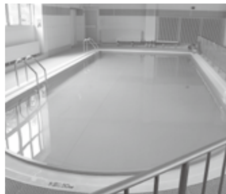
10m・幅4m・水深0.5m～0.6m お子様でも安心な幼児用プールです。