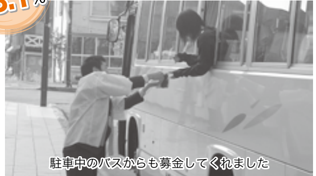
駐車中のバスからも募金してくれました