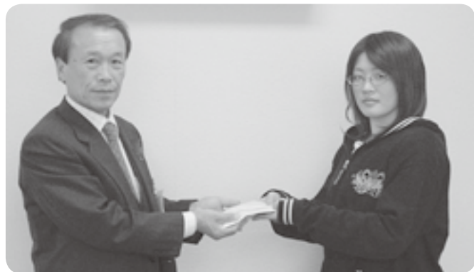
久慈高等学校長内校の生徒の皆さんから「地域に役立ててください」と届けられました