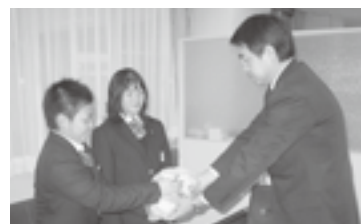
久慈東高等学校からも袋いっぱい “みんなの思い”が届けられました