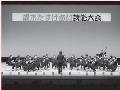
久慈中学校マンドリン部