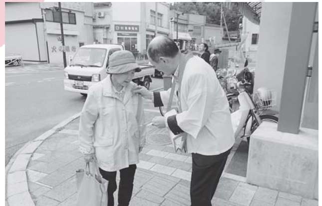
街頭募金活動の様子