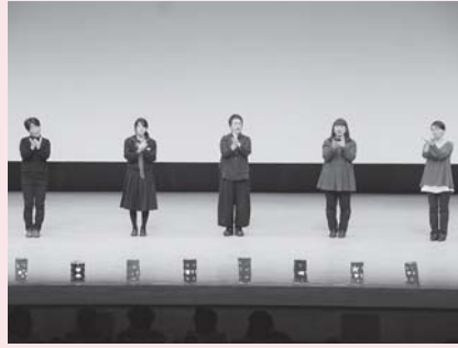
手話サークル輪っこの会