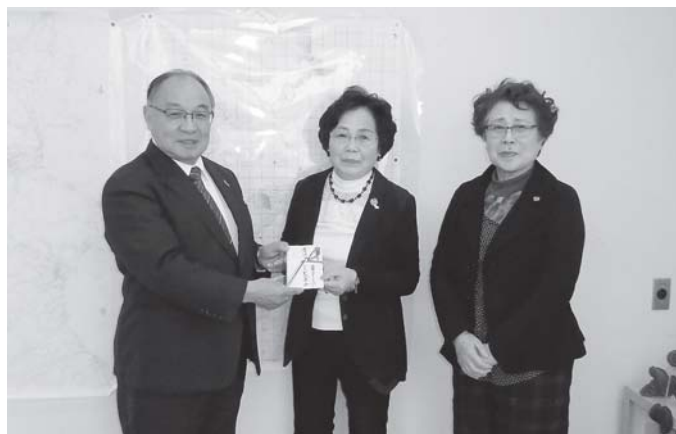
今年も篤志募金にご協力いただいた国際ソロプチミスト久慈の皆様