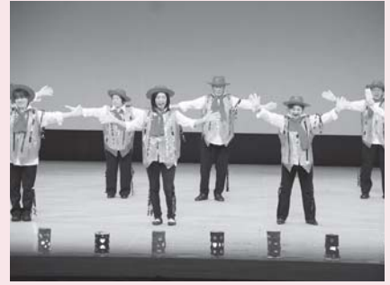
夏井町シニア軍団