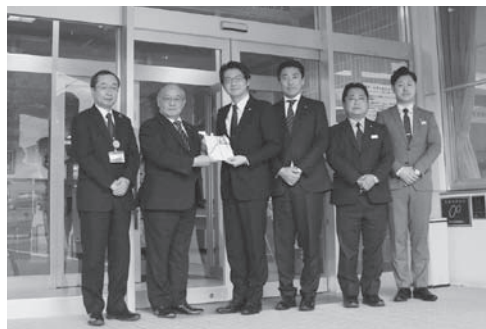
トヨタカローラ岩手(株)の皆様