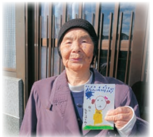
友愛はがきが届くのを楽しみにしています。と嬉しそうに園児から届いた友愛はがきを見せてくれました。