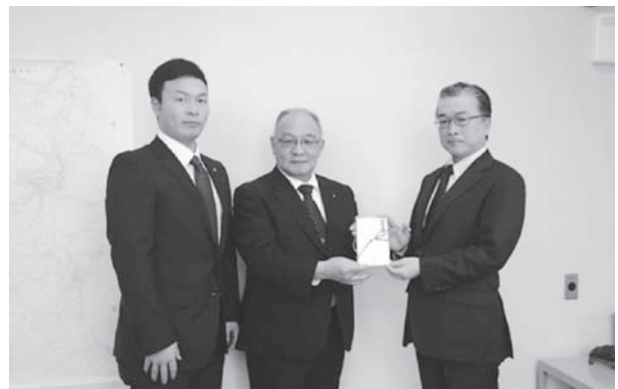
平成3年から歳末たすけあい募金にご協力いただいている日本地下石油備蓄㈱久慈事業所の皆様