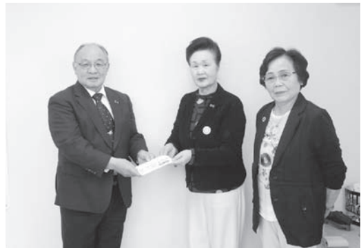
赤い羽根募金にご協力いただいた 国際ソロプチミスト久慈の皆様