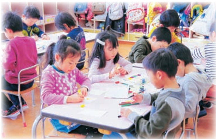
園児たちは、届いた方達が元気になるような絵（節分、雪だるま、動物など）を描きました。