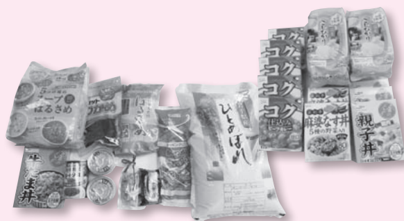
いただいた一部食料品

なお、食品のご提供は随時受け付けておりますので、皆様のご協力をお願いいたします。