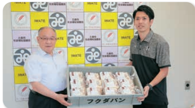
いわてグルージャ盛岡様から福田パン様の食パンを届けていただきました

新型コロナウイルスの感染拡大により、家計の負担が大きくなるなど、生活に対する不安が大きくなる中、8月6日にフードパントリー事業（食料支援）の実施と相談窓口を開設しました。この事業に向けていわてグルージャ盛岡様から福田パン様の食パンを届けていただいたほか、地域の方々、企業の皆様からご寄付・ご協力いただいた食料を40世帯へ配布しました。