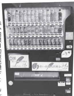
赤い羽根自動販売機イメージ

久慈市共同募金委員会では、地域福祉を推進するための財源確保として、「赤い羽根自動販売機」の設置推進に取り組んでいます。この自動販売機は、清涼飲料水の売り上げの一部を募金として寄付していただくもので、募金は福祉教育事業や障がい者施設の運営、災害ボランティア養成事業など、設置した地域の様々な地域福祉活動に活用されます。