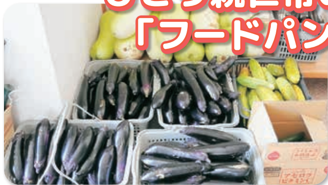
自宅で採れた野菜を寄付いただきました