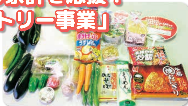
各世帯へお配りした食料品