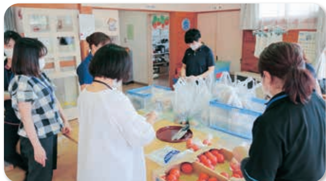
各世帯への仕分け作業中