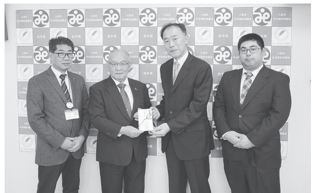
平成3年から歳末たすけあい募金にご協力いただいている日本地下石油備蓄㈱久慈事業所の皆様