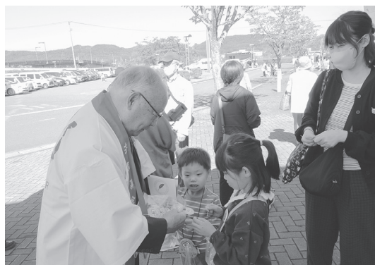
久慈地方産業まつり会場での街頭募金活動 (久慈市共同募金委員会)