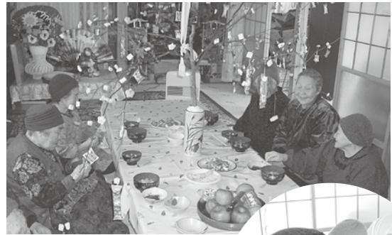
おらあ～くるみ餅が いいなあ