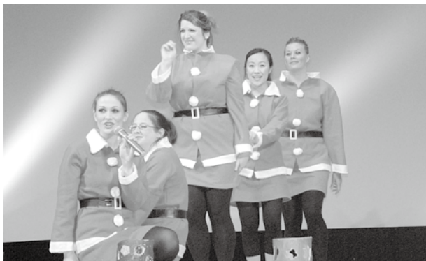
今年のステージはインターナショナル!!