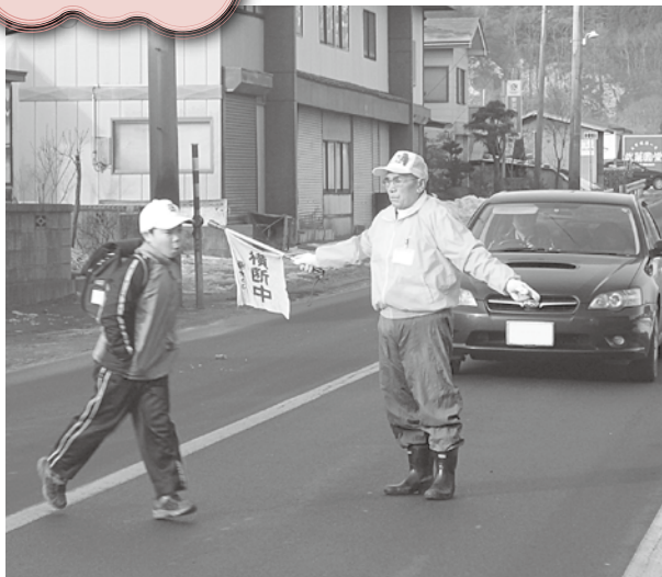
車を止めて横断させている様子