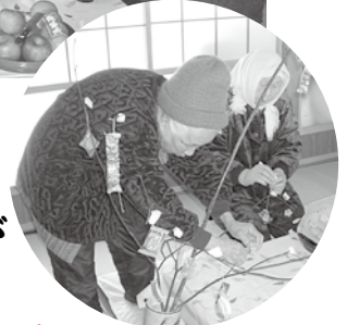
おらあ～あんこが いいべえが