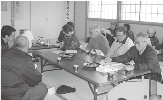
今日の血圧 どうだべえ～

実施した場合は1ヶ月2千円を限度に助成します。詳しくは社協Tel 53-3380までお問い合わせください。