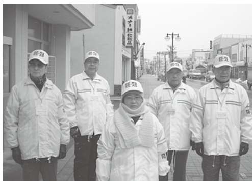
中町防犯パトロール員のみなさん

中町老人クラブでは、平成18年3月からパトロール活動に取り組んでいる。当初6名の会員で町内の巡視を行っていたが、今は曜日を担当し、毎日誰かがパトロールをするようにしている。パトロールをしてみると楽しみが意外に多い。子供達との挨拶の交換や、立ち止まってのちょっとした遊び、手にした作品の説明を聞いたり、学校でのことや友達のこと等、顔馴染みになった子供達との会話は実に楽しい。孫との会話の無い年寄りにとっては、得難い癒しの時間でもある。明るく素直で元氣な子供達の笑顔に接すると、「車に気をつけて」、「皆と仲良くね」、「風邪ひくなよ」と声が出る。そして、どの子からも「ハイ」と返事が返ってくる。可愛いこの子供達を、事故や犯罪の被害者に決してさせてなるものか、と心に念じながらのパトロール活動である。（中町 横島記）