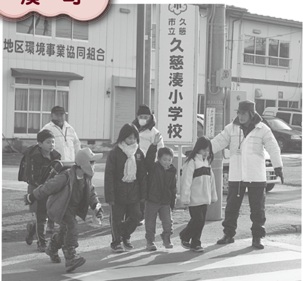
気をつけてネ。久慈湊小学校前横断歩道