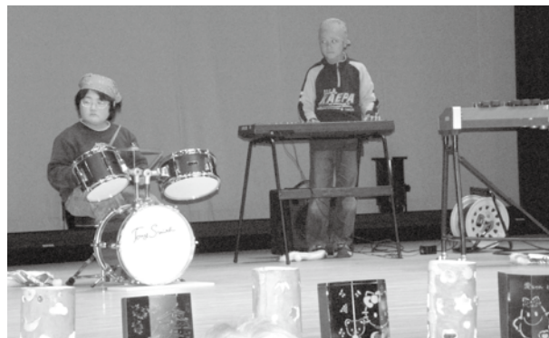
繫小学校のみなさんによる「繫バンド」演奏中。