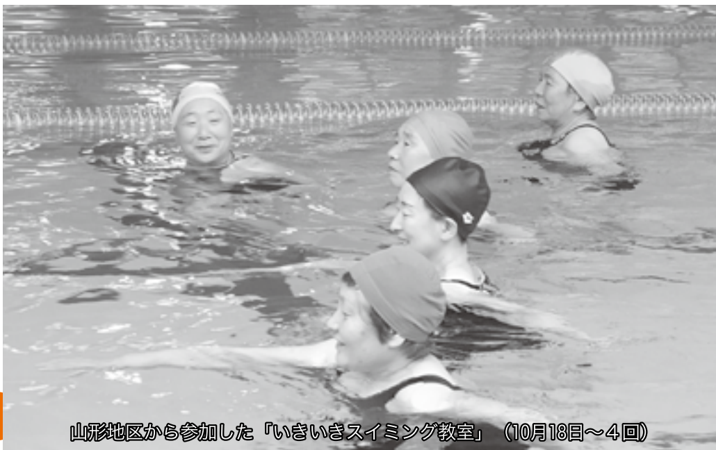
山形地区から参加した『いきいきスイミング教室』（10月18日～4回）

福祉の村では施設を活用した いきいき健康づくりと 心のかよう出会いを 応援しています