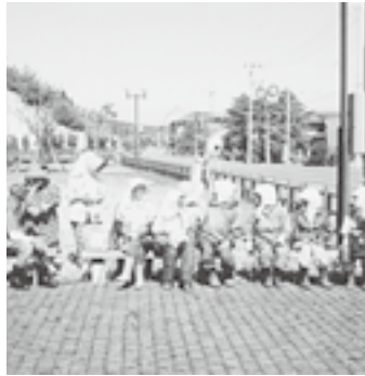
▲花壇の草とり作業のあと 一服中のクラブの皆さん