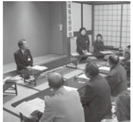
▲介護の問題・地域サービスなどについて、意見や期待の声が寄せられました。

地域の方々への社協事業の周知と、地域での困りごとや問題になっていることを把握し今後の事業に反映させるために、市内11ヶ所で開催いたしました。