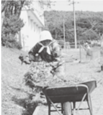
▲地域の学校周辺の刈払い作業

老人クラブでは全国一斉に「社会奉仕の日」を設定し、環境美化活動に取り組んでいます。「花のあるまち」「ゴミのないまち」活動など地域に沿った通年活動も実施しています。