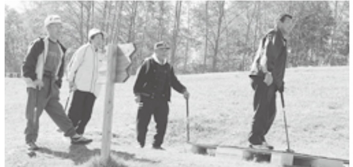
▲1チーム4人編成。仲間の打ったボールから目が離せません。

平庭高原パークゴルフ場を会場に、51名の参加をいただき競われました。広い会場は、ゴールを目指すチームメイトの声援と歓声に包まれていました。参加費のうち63,830円を赤い羽根共同募金へ寄付させていただきました。ありがとうございます。