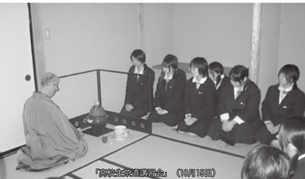
『高校生茶道講習会』（10月15日）

水中で汗をかく実感!!地上の運動に比較して足腰への負担は軽く、運動効果が大きい水中ウォーキング。足腰の鍛錬はもちろんですが、プールに映えた笑顔はリフレッシュの効果も大きかったようです。