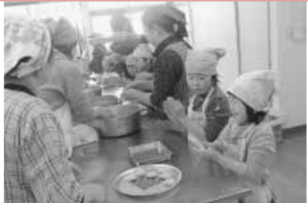
ごま団子をまるめている様子

三世代料理教室も行われ、収穫したさつまいもを使ったごま団子作りを通して世代間の交流が図られました。