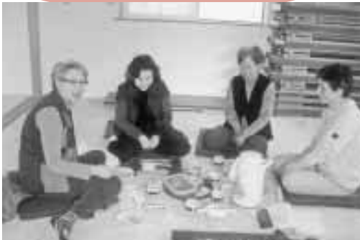
お茶のみしながら「たぐきり」しています