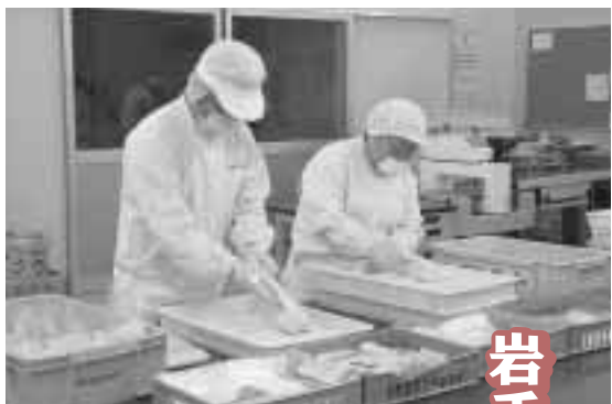
「福祉工場みずき」でラーメンを袋詰めしている様子