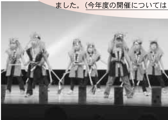
歳末たすけあい芸能大会（昨年度） 門前保育園

昨年度の歳末たすけあい芸能大会（会場：アンバーホール）の益金と歳末たすけあいチャリティ演芸会（会場：おらほーる）のお花（義援金）の合計642,722円は平成20年度歳末たすけあい募金に充てられました。（今年度の開催については7ページをご覧ください。）