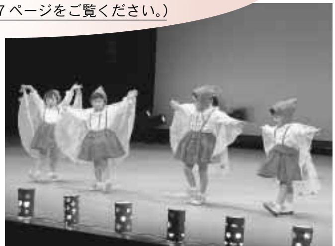
歳末たすけあいチャリティ演芸会（昨年度） 来内保育園