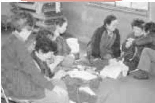
この日は、みんなで編み物をしました