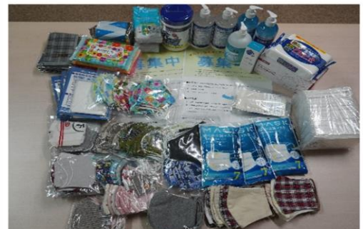
ご寄付いただいた衛生用品の一部