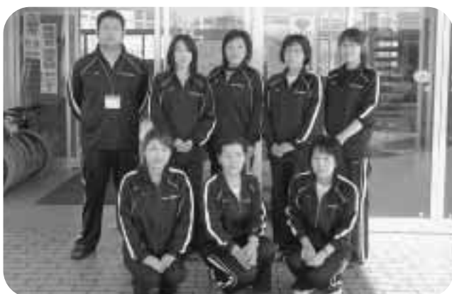
8名のケアマネジャーが丁寧にご相談に応じます

介護支援専門員（ケアマネジャー）を募集しています！ 一緒に、介護が必要な方のお手伝いをしましょう！