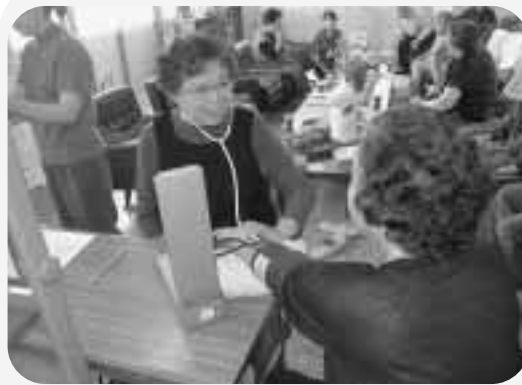
『ボランティアルームサロン「たぐきり」』で ボランティアさんによる血圧測定の様子

助成を受け購入した備品は、「たぐきり」では、こころの健康づくりの推進のために、「久慈かたくりの会」では、会報やポスター作成のために、幅広く活用させていただきます。赤い羽根共同募金に募金してくれた皆さまに感謝を申し上げます。ありがとうございました。