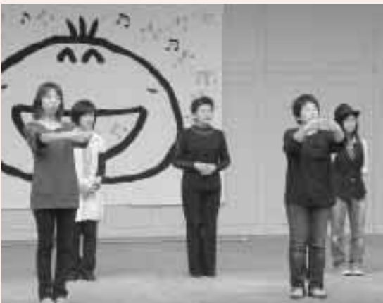
9月23日のふれあい福祉まつりで、ステージ発表を行いました

毎週木曜日、勤労青少年ホーム（川崎町）にて18:30~20:00まで聴覚障がい者と共に手話の学習を行っています。聴覚障がい者とコミュニケーションをとりたい方、手話を一緒に習いましょう。初心者大歓迎です！お待ちしております。