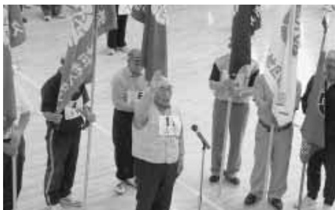
平成20年度いきいきシルバースポーツ大会選手宣誓