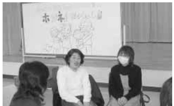
みんなで普段着ボランティアの集い ホンネ！語るべえ～し！！