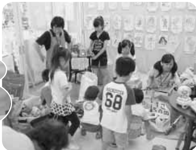
おもちゃマーケットの様子