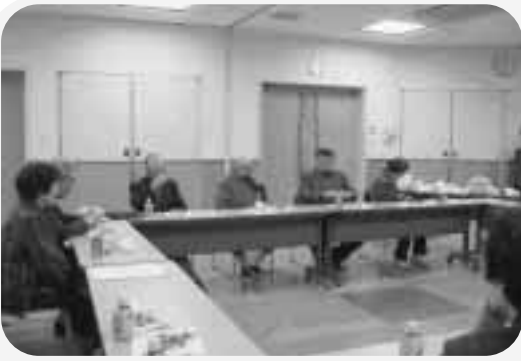
「久慈かたくりの会」定例会の様子