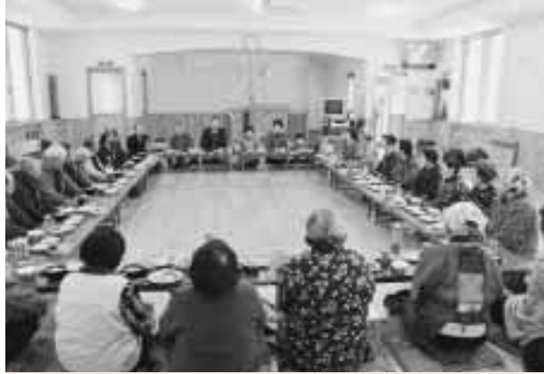
小正月をみんなで喜びました