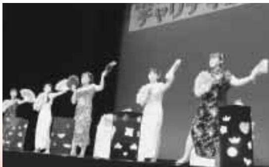
特別養護老人ホーム 愛山荘