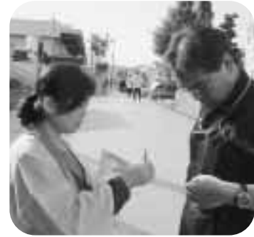
10月1日 街頭募金 ご協力ありがとうございました。