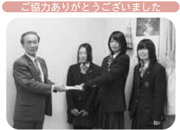
久慈東高等学校のみなさん。 ありがとうございました。