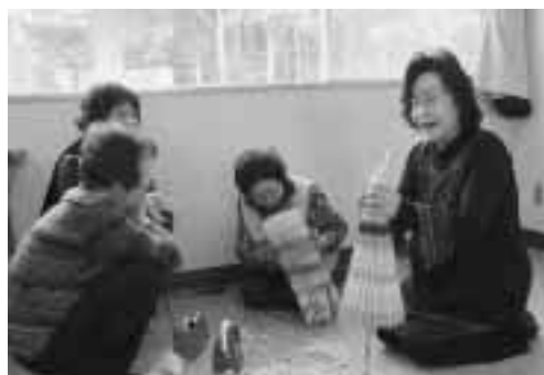
紙細工講習会の様子

平成22年度趣味の作品展示即売会は、2月5日～6日の2日間、久慈市総合福祉センターで行われました。久慈管内の（久慈市・洋野町・野田村・菅代村）高齢者の皆さんが作製した木工・竹細工・ワラ細工・手芸など自信作2,200点が展示・販売されました。 6日には、紙細工講習会も開催され、チラシを活用した傘飾りに37名が挑戦しました。半日ばかりで見事な傘飾り37本が完成しました。