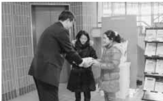
小久慈小学校のみなさん。 ありがとうございました。