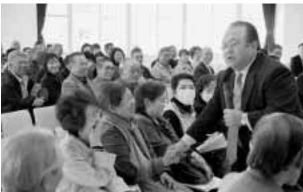
志村尚一氏による記念講演