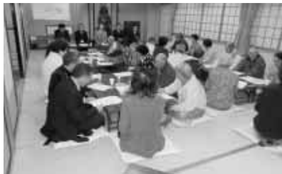
小久慈地区説明会