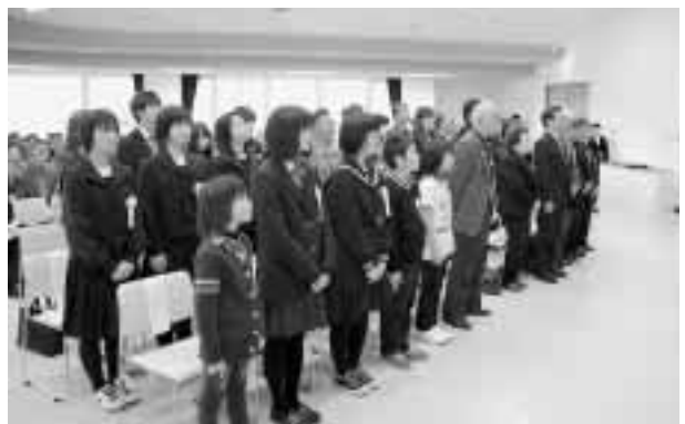
表彰を受けられた皆様、おめでとうございます