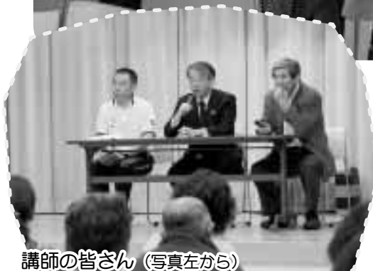
講師の皆さん (写真左から)