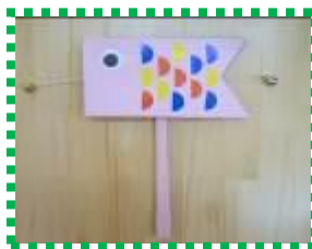
「こいのぼりの でんでんたいこ」