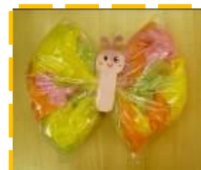
「ふんわりちょうちょう」

4月は『こいのぼりのでんでんたいこ』作り、5月は『ふんわりちょうちょう』を作ってお楽しみしました。毎月、開催しているのでどうぞお気軽にご参加ください。お待ちしております。