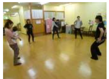
↑ 去年の親子体操の様子です!