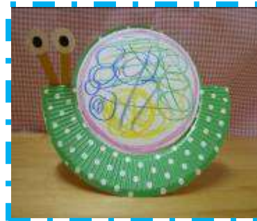
「ゆらゆらカタツムリ」

SUNSUN ひろばの親子あそびは、身近にある材料で簡単にできる手作りおもちゃ等の製作活動を行っています。4月は『こいのぼり』をお花紙で作り、5月は紙皿を使って『ゆらゆらカタツムリ』を作ってあそびました。毎月、開催しているのでどうぞお気軽にご参加ください。お待ちしております。